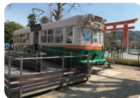
岡崎・市電コンシェルジュ