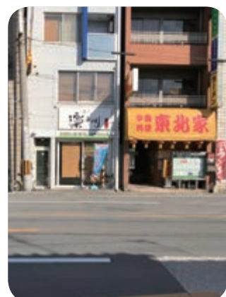
京の楽チャリ東山三条店