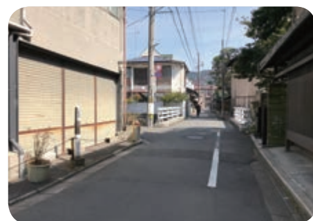
石泉院橋手前で本コースと合流