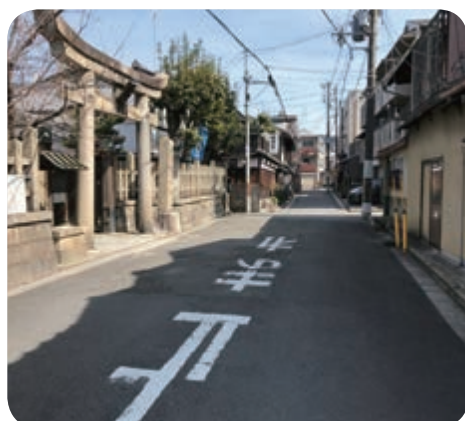
レンタル拠点を右に出て、東へ進む