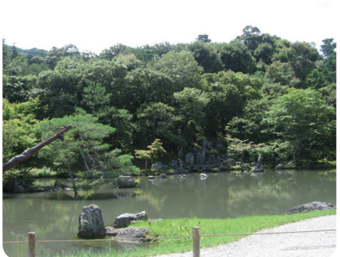
天龍寺・曹源池庭園

竹林では竹の間から差す日の光と竹の葉がそよ風に揺れる音に心を癒し、禅宗の名刹・天龍寺周辺や渡月橋など嵐山を代表する観光地を満喫します。