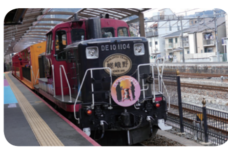
嵯峨野トロッコ列車

嵐山・嵯峨野の観光地をぐるりと周遊し、嵯峨野トロッコ列車に乗車して四季折々の自然の峡谷美を満喫します。 ※トロッコ列車は運行を休止している期間があります。